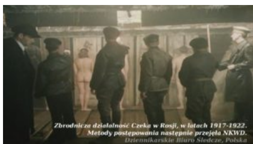
Zbrodnicza działalność Czecha w Rosji, w latach 1917-1922. Metody postępowania następnie przejęła NKWD. Dziennikarskie Biuro Śledcze, Polska