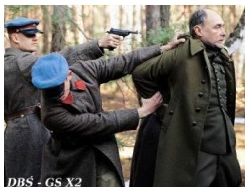
DBŚ - GS X2

Moskwa: Aleksander Sołżenicyn – pisarz rosyjski, który ujawnił ogrom zbrodni żydowskich w Rosji